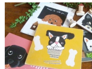
シェリーの小屋さん 木工雑貨

ぬくもり溢れる木工雑貨 が今年も勢ぞろい！ お気に入りのわんこを 見つけてくださいね。