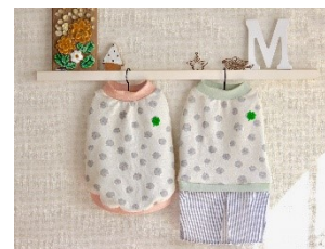
moco*noteさん 首輪・リード・洋服等

可愛いはんこが大集合！ なんにでも押して愛犬の オリジナルグッズを作って みませんか？