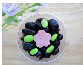
お花見黒豆ぼーろ 150円