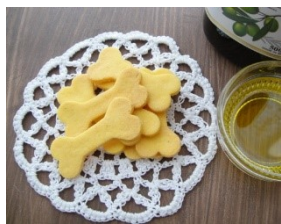
チーズクッキー 120円

主に道産のお肉やお魚を使用した手作りジャーキー・クッキーが約15種類！ジャーキー大袋も登場！人気の鹿角もサイズ豊富にご用意しています。