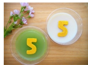
5周年記念ゼリー 100円