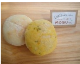
道産小麦のわんこぱん 120円 ※お一人3個まで